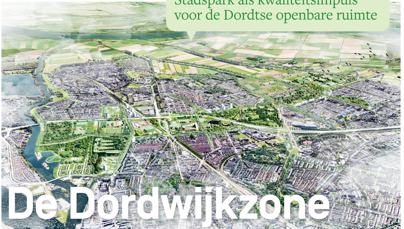
De Dordwijkzone in vogelvlucht.

Stadspark als kwaliteitsimpuls voor de Dordtse openbare ruimte